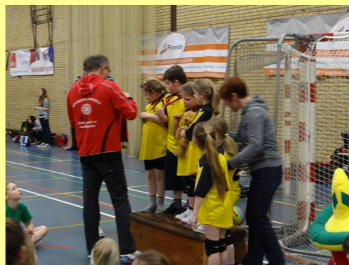
Prijsuitreiking winnaar niveau 2.