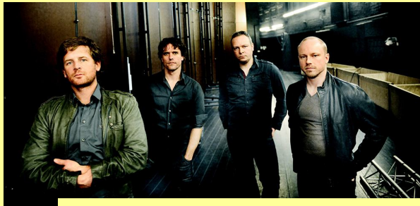
Racoon op Pop on Top 1 juni 2013

Tijdens Pop on Top staan dit jaar op het hoofdpodium topformaties als Kane, Waylon, Racoon, Leona Philippo, Nielson en Mephis Maniacs geprogrammeerd. Meer info via www.popontop.nl